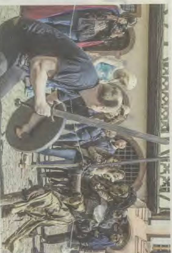
Face aux Orques, l'épée ne devait pas trembler.