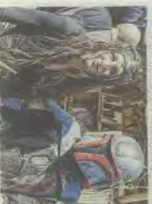
Quand Star Wars fait une incursion dans la Terre du Milieu.