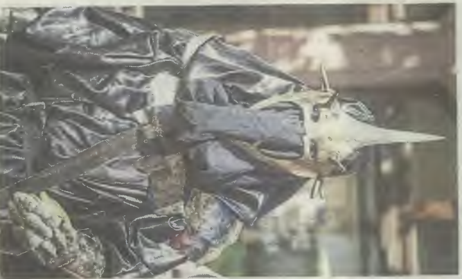
Les terribles Nazgûls ont traîné leur ombre menaçante dans les rues de Kaysersberg.

Ce week-end, le Festival du jeu de rôle de Kaysersberg a une nouvelle fois rencontré un beau succès avec, en toile de fond, l'univers du Seigneur des Anneaux imaginé par Tolkien, il y a soixante ans. Retour en images au cœur de cet univers peuplé d'Orques, d'Elfes et de Hobbits.