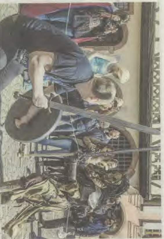
Face aux Orques, l'épée ne devait pas trembler.