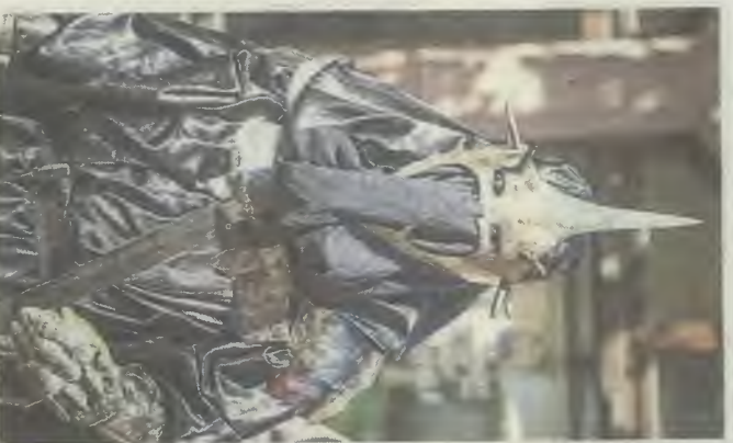
Les terribles Nazguls ont traîné leur ombre menaçante dans les rues de Kayserberg.

Ce week-end, le Festival du jeu de rôle de Kayserberg a une nouvelle fois rencontré un beau succès avec, en toile de fond, l'univers du Seigneur des Anneaux imaginé par Tolkien, il y a soixante ans. Retour en images au cœur de cet univers peuplé d'Orques, d'Elfes et de Hobbits.