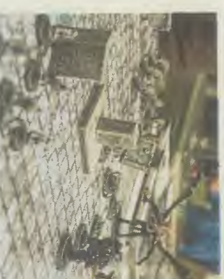
Le jeu de rôle, c'est aussi autour d'un plateau avec des figurines et des cartes.