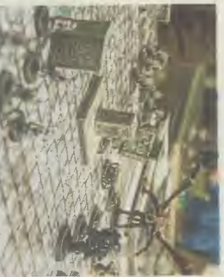
Le jeu de rôle, c'est aussi autour d'un plateau avec des figurines et des cartes.