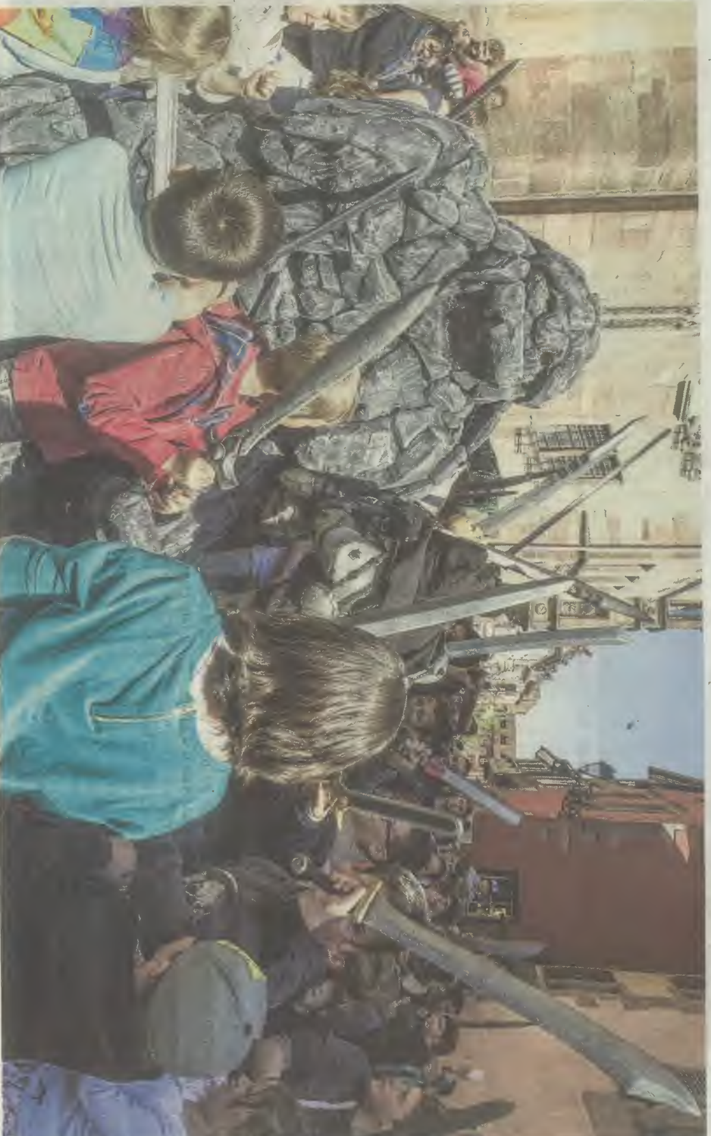
L'armée des enfants a réglé son compte à l'effroyable golem venu des entrailles de la terre.