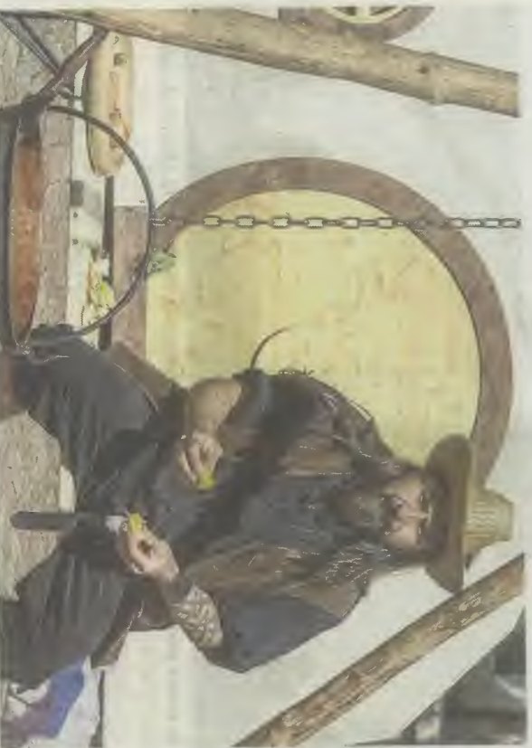
Que serait un Hobbit sans sa nourriture ?