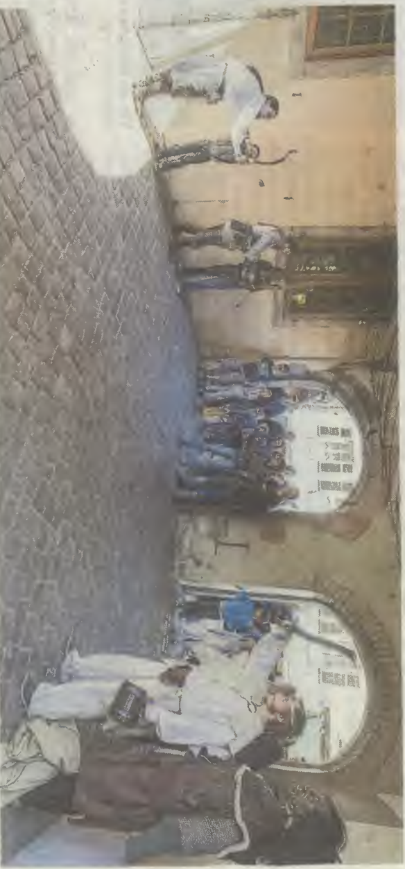
La maîtrise du tir à l'arc est indispensable pour devenir un elfe aguerrri.