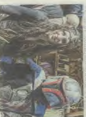
Quand Star Wars fait une incursion dans la Terre du Milieu.