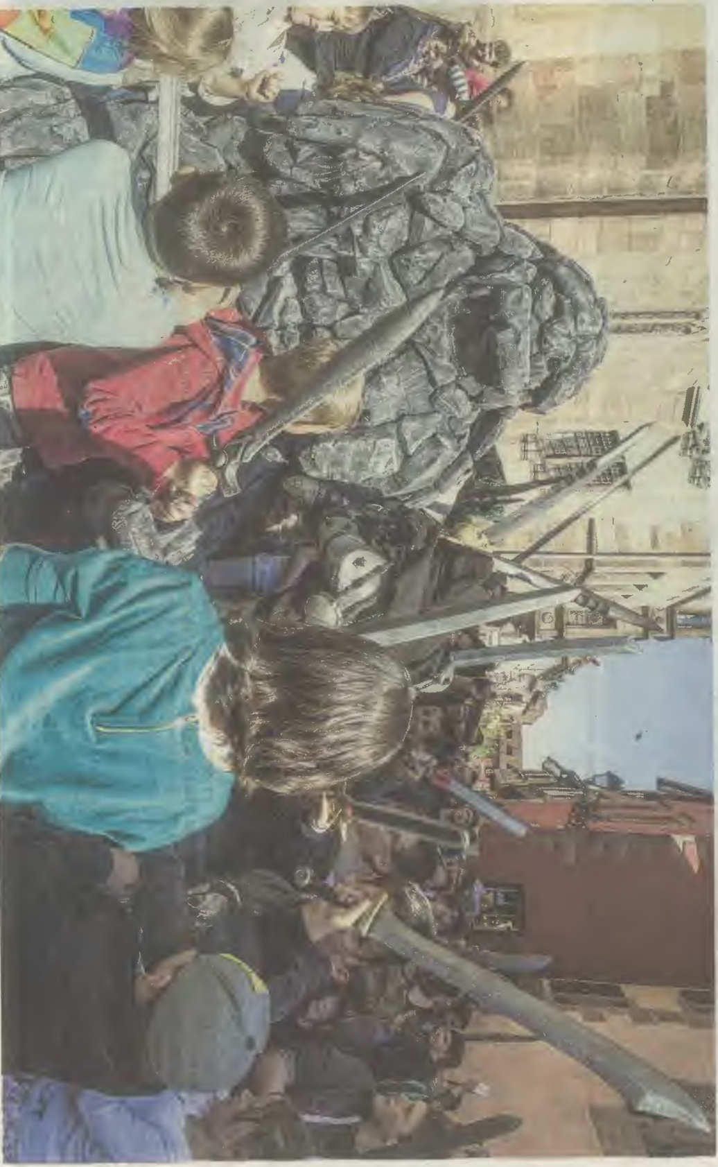
L'armée des enfants a réglé son compte à l'effroyable golem venu des entrailles de la terre.